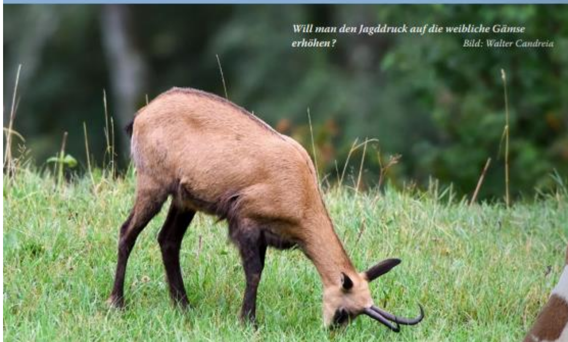
Will man den Jagddruck auf die weibliche Gämse erhöhen?

Die Societed da chatscheders Engiadin'Ota hat sich mit dem Thema «Mitführen von Hunden» intensiv beschäftigt. Dabei wurde die Idee der Begleithunde ohne jagdliche Aufgaben entworfen. Damit möchte die Sektion die Mitnahme von jeglichen Hunden eindeutig regeln. Die JHV äussert sich zu dieser Hundekategorie bisher nicht. Es wird lediglich die Mitnahme von Schweiss-hunden geregelt: